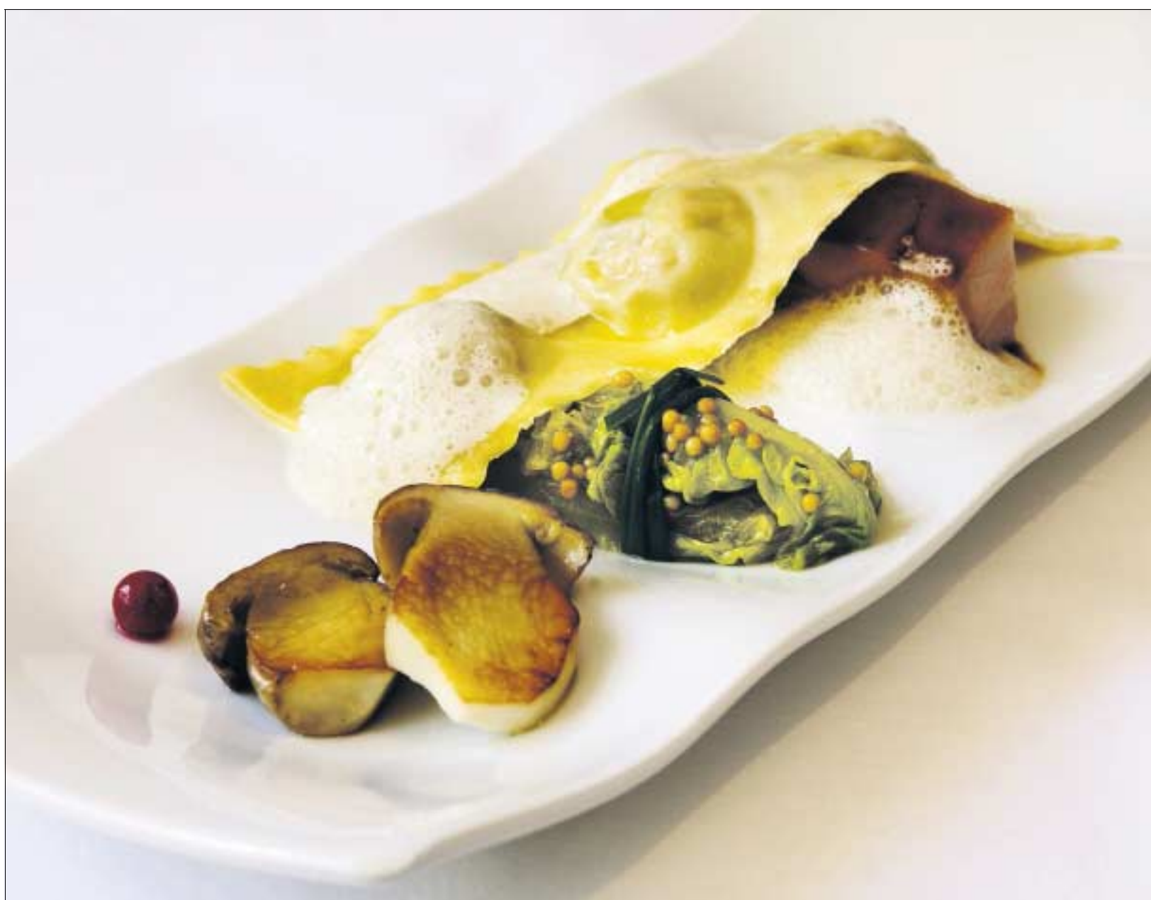
Schön angerichtet: Ravioli mit Spanferkel- Meerrettich-Füllung, Steinpilzen und geschmortem Kopfsalatherz mit Senfsaat.

Braatz, Sautter, Swoboda: WeinAtlas Deutschland, Hallwag-Verlag, München, 99 Fr.