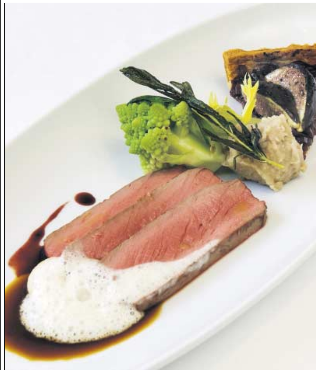
Herbstlich: Gamsrücken auf Marronipüree mit Rotweinzwiebel-Feigen-Tarte und Wacholderlack.