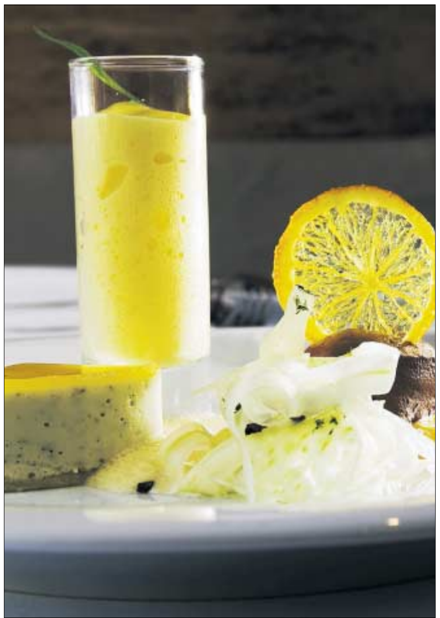
Überraschend: Fenchelmousse mit Schokoladeneis, dazu Orangen-Estragon-Espuma.